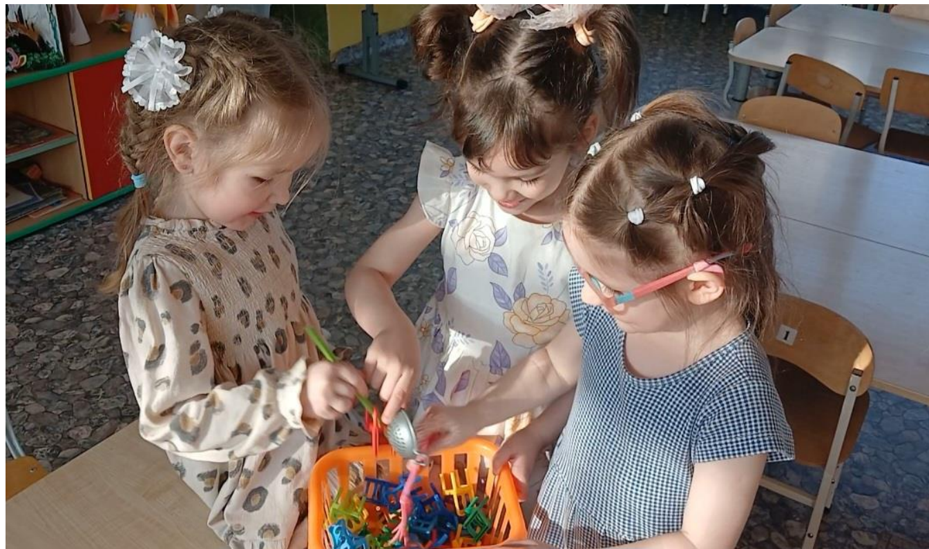
«Тесто для вкусняшек»