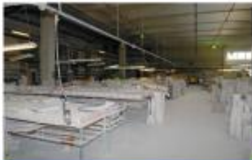
Общий вид формовочного цеха