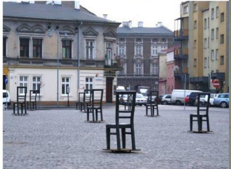
«Стул за 1000 евреев» (Краков, Польша)