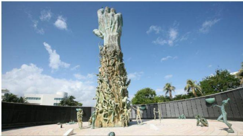
«Рука»(Майами,США) Кеннет Трейстер