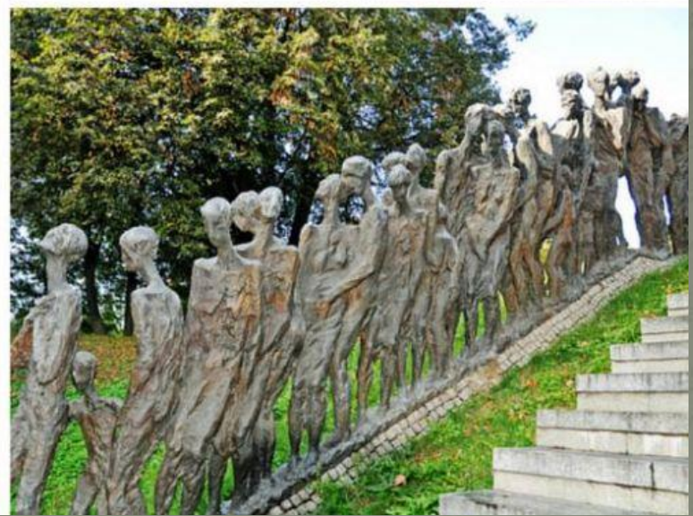
«Яма» (Минск, Беларусь)