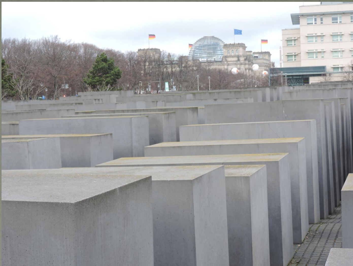
«Плиты, плиты» (Берлин, Германия) скульптор Питер Айзенман