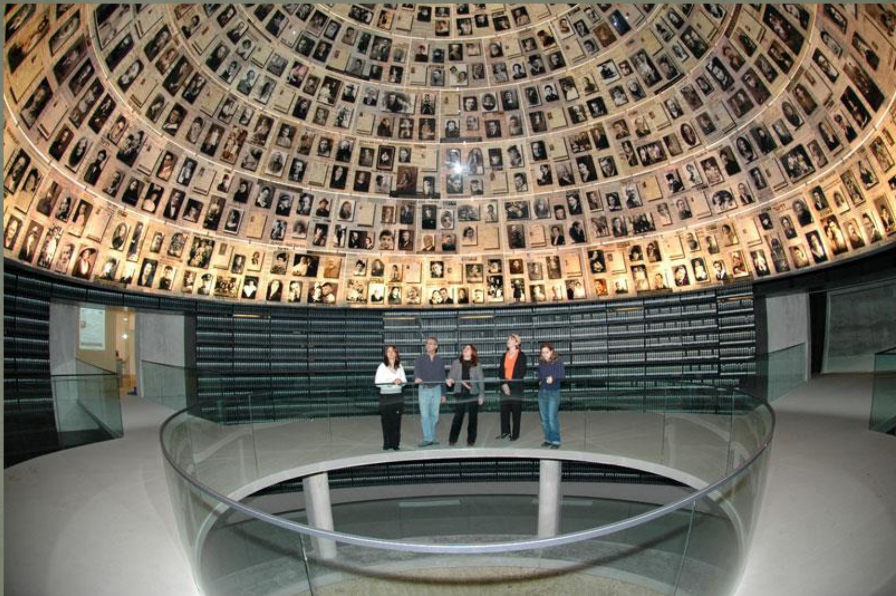
«Зал имен» в музее Яд Вашем