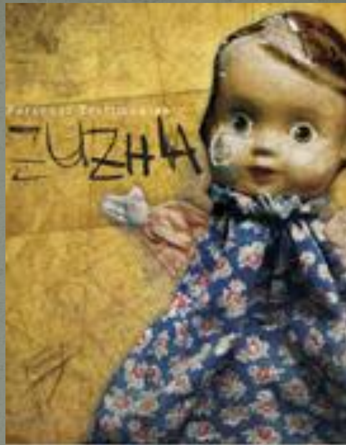
Зося в детстве