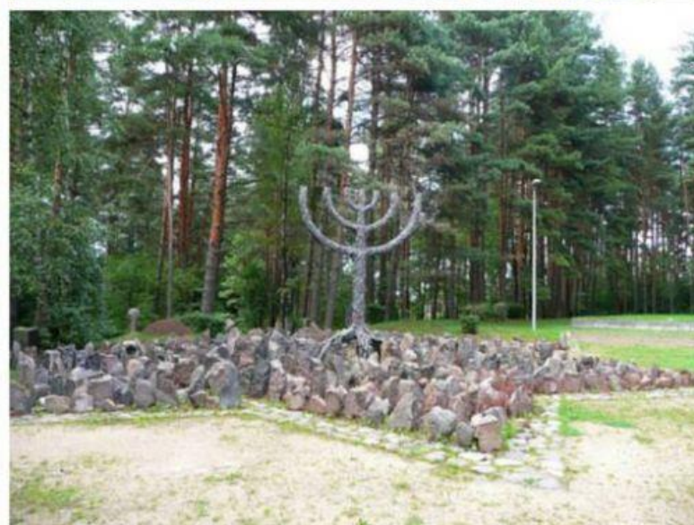
«Лес» (Рига, Латвия)