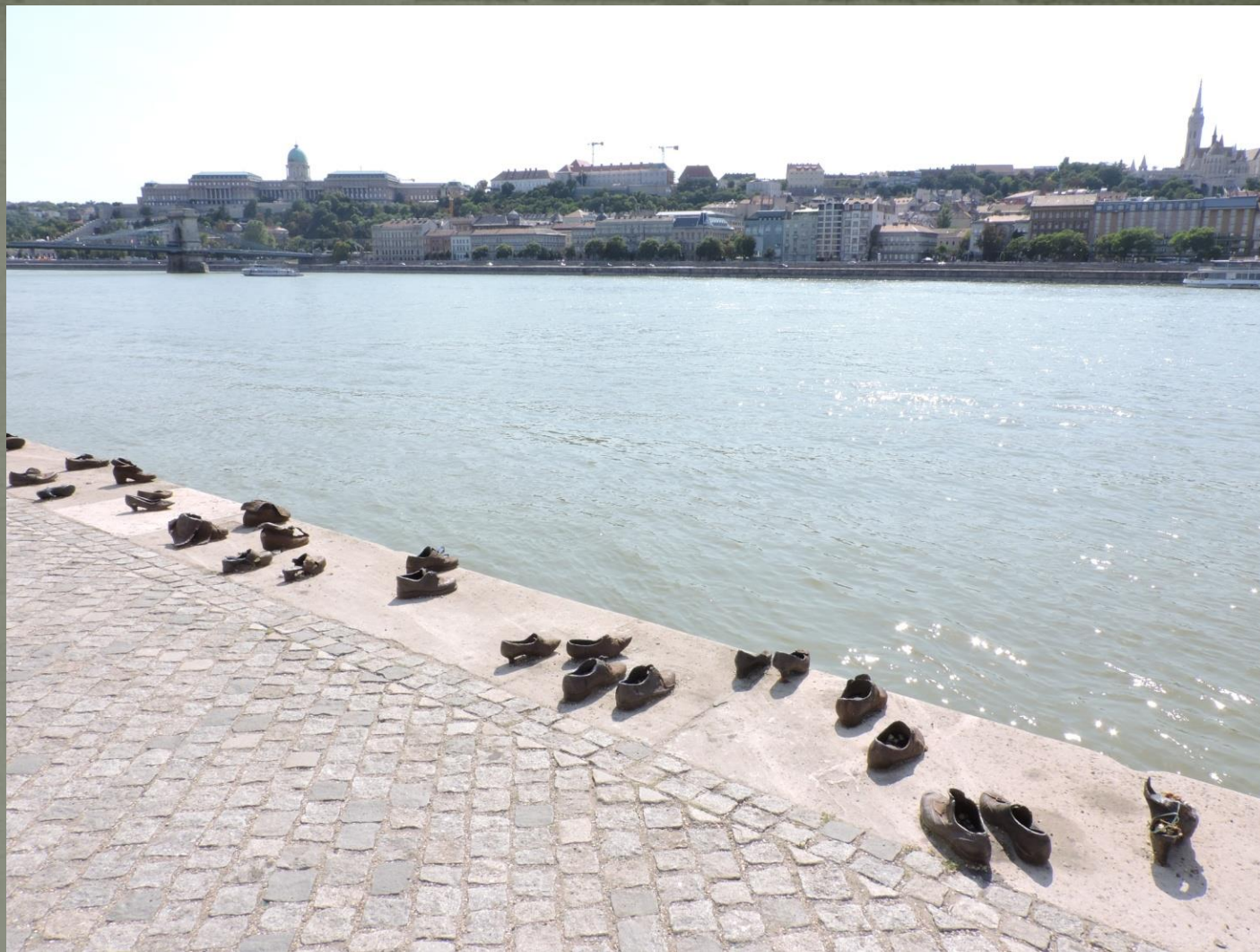
«Обувь на берегу» (Будапешт, Венгрия) скульптор Дьюла Пауэр