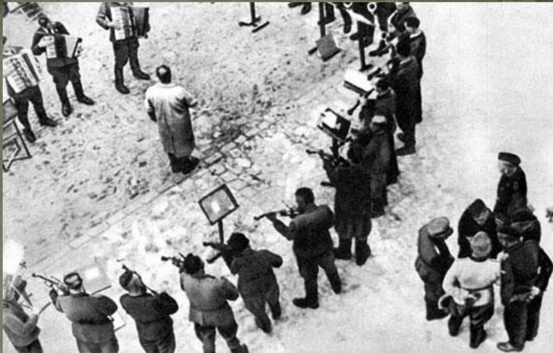
Оркестр Яновского концлагеря