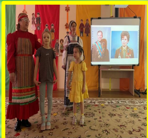
«День Народного Единства»