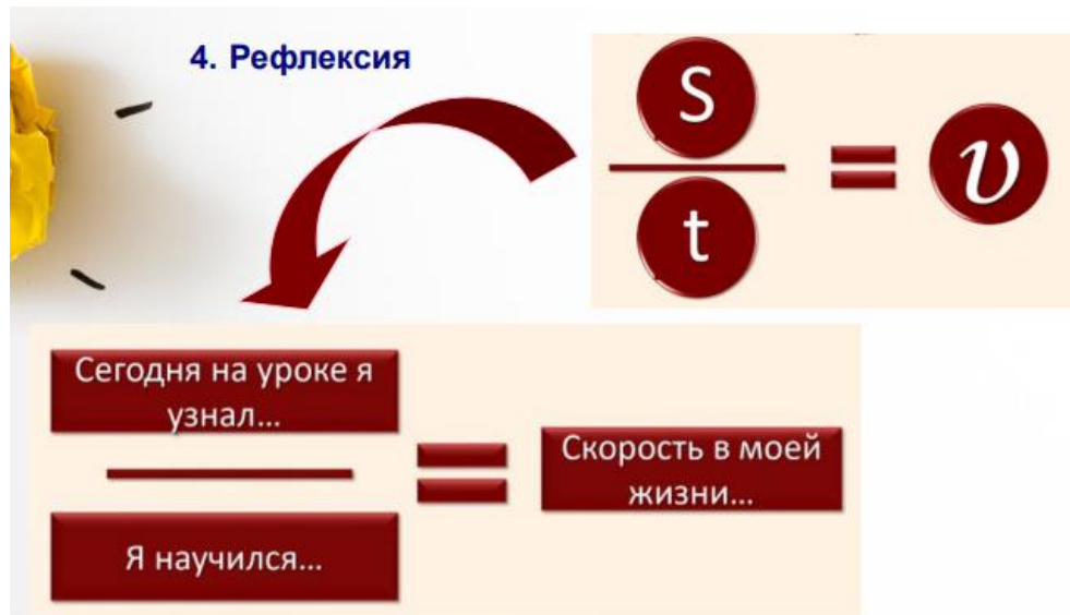
Рис. 2. Критерии оценки эссе

Завершает метапредметный урок этап рефлексии, который предлагается организовать с помощью приёма «Незаконченное предложение». Теперь уже всеми узнаваемая формула скорости трансформируется в несколько слагаемых, а продолжения фраз «Сегодня на уроке я узнал...», «Я научился...» приводят учеников и к пониманию того, какую роль скорость играет в их собственной жизни и, как следствие, что необходимо сделать, чтобы роль эта была исключительно положительной (см. рис. 3).