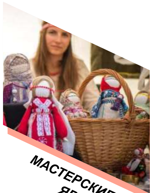
МАСТЕРСКИЕ И ЯРМАРКИ