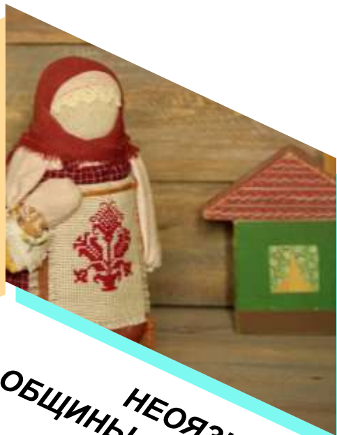
НЕОЯЗЫЧЕСКИЕ ОБЩИНЫ ("РОДНОВЕРЫ")