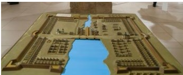
Макет Екатеринбургского железоделательного завода с поселением

И в Екатеринбурге с самого начала: каждому рабочему – свой дом. Конечно, была несправедливость, жестокие наказания, нерегулярная выдача заработной платы, обшеты и штрафы. Но все-таки у каждой семьи дом и хозяйство. У нас в Сысерти сохранились целые старые улицы, на поселение нищих никак не похожие.