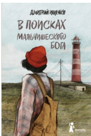
Книга-победитель в номинации «Выбор детского жюри»