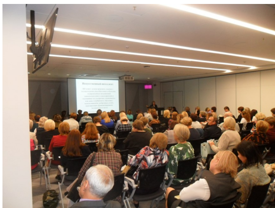
Презентация проекта «Читающая школа» в ходе Областного педагогического совещания. 28 августа 2019 г.

интерес способен стать тем «золотым ключиком», который откроет ребенку путь к качественному образованию.