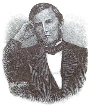
К. Д. УШИНСКИЙ. 1859 г.

К.Д. Ушинский. Человек как предмет воспитания. Опыт педагогической антропологии: Режим доступа: http://dugward.ru/library/pedagog/usinskiy_chelovek1.html#pred