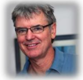
Джон Хэтти «Видимое обучение»