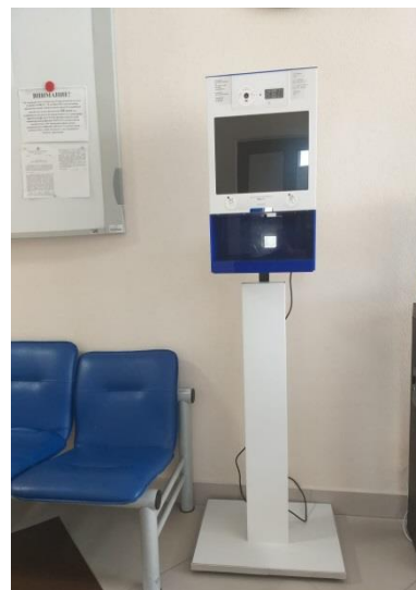
Тепловизор/дезинфектор напольный автоматический